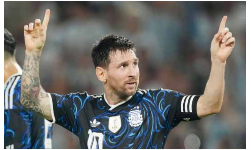
Nueva inversión. Por primera vez asume la propiedad total de una institución europea.

El capitán argentino adquirió el 100% del UE Cornellà, un equipo de la quinta división española, y refuerza su apuesta por el desarrollo de talentos y su vínculo con Cataluña.