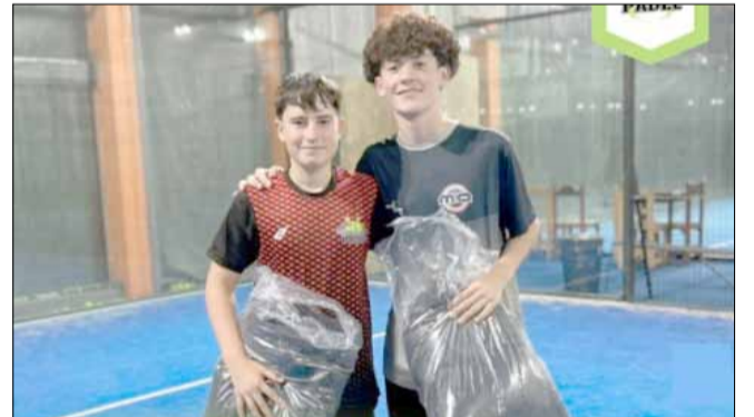
Reyes - Villarreal, ganadores en Séptima.