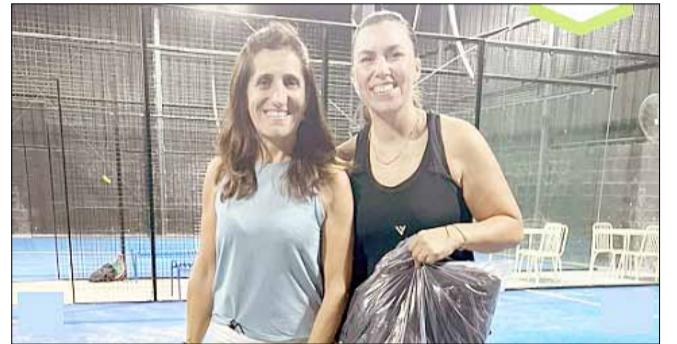
Netri - Belleza, ganadoras en Séptima Damas.

Lo que viene De acuerdo a lo informado por la Agrupación, los