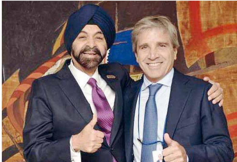
En Washington. Caputo junto a Ajay Banga, presidente del Banco Mundial.

En este marco, el Banco Mundial reforzó su respaldo a la administración de Javier Milei al expresar que "en las Reuniones de Primavera el Grupo Banco Mundial reafirmó su sólido apoyo a los esfuerzos de reforma de Argentina para fortalecer las condiciones para el crecimiento, la inversión y la creación de empleo, incluidas medidas para mejorar las condi-