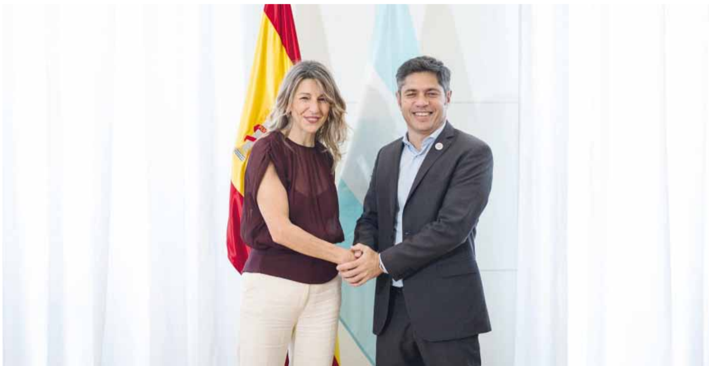
El Gobernador junto a la ministra de Trabajo y Economía Social de España, en una foto que sirvió para contrastar la agenda del Presidente.

formas económicas del Gobierno, mientras el titular del Palacio de Hacienda gestiona nuevos acuerdos con organismos multilaterales para afrontar vencimientos y sostener la confianza de los mercados. Página 2