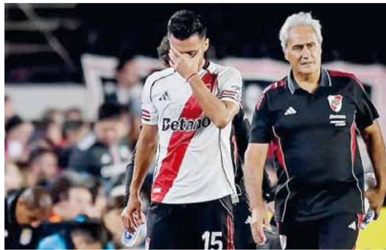
Baja. El exfutbolista de Argentinos Juniors sufrió un esguince grado 2 en el ligamento colateral medial de su rodilla derecha.

Otra opción es Giuliano Galoppo, aunque llega sin ritmo tras una lesión de tobillo. El propio entrenador admitió que todavía necesita trabajo antes de volver a