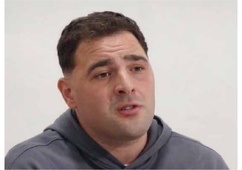
Condena. El rugbier recibió 15 años de prisión como partícipe secundario.