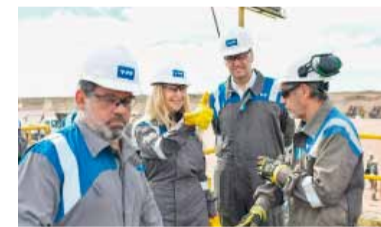
Otro gesto. Karina junto a Adorni.

En medio de nuevos movimientos en la causa que lo investiga por presunto enriquecimiento ilícito, el jefe de Gabinete, Manuel Adorni, convocó una nueva reu-