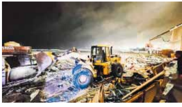
La demolición de "la Saladita".

Mar del Plata: derriban la Feria de la Bristol