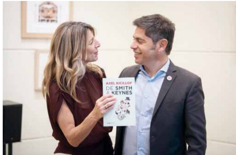
De visita. Kicillof junto a la ministra de Trabajo y Economía Social de Pedro Sánchez, Yolanda Díaz.

En la agenda de la discusión apareció con énfasis la cuestión laboral: España debate una reducción de la jornada de trabajo impulsada por el PSOE y la ampliación de las licencias parentales, además de un aumento de las indemnizaciones por despido. Kicillof mencionó el reciente fallo de la Suprema Corte que reconoce a los trabajadores de plataformas como empleados -y no asociados- en una causa que se originó por una intervención de su ministerio