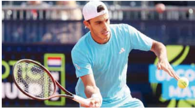
Firme. El tenista argentino fue contundente y se impuso por 6-3 y 6-0.

“Es fantástico ganar un partido corto, de forma tan rápida. Mi objetivo no es ganar así, sino ha-